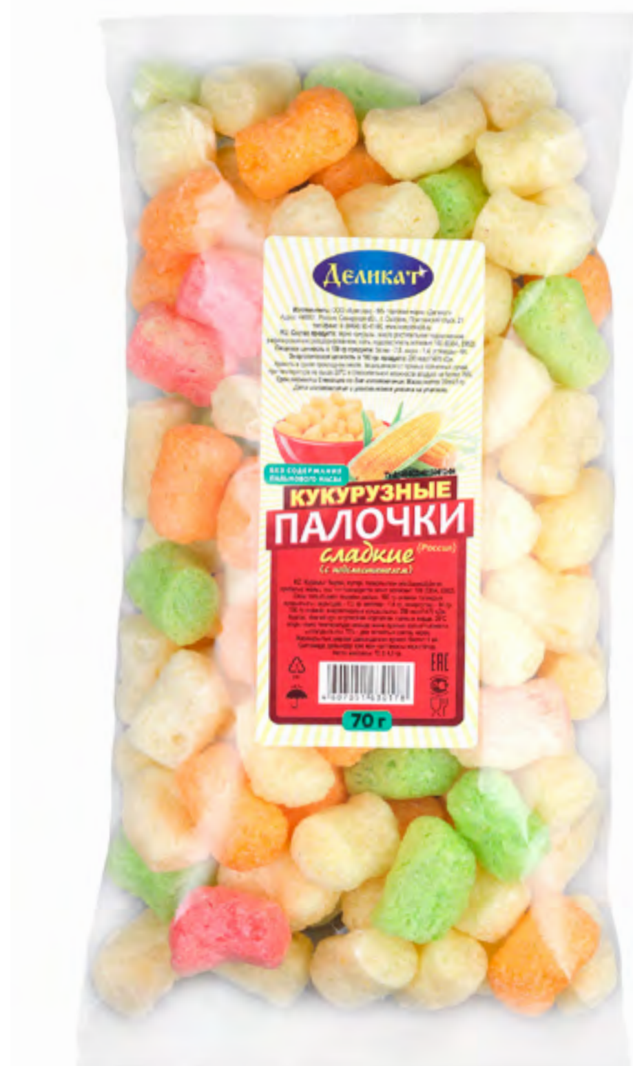
Кукурузная палочка С ПОДСЛАСТИТЕЛЕМ