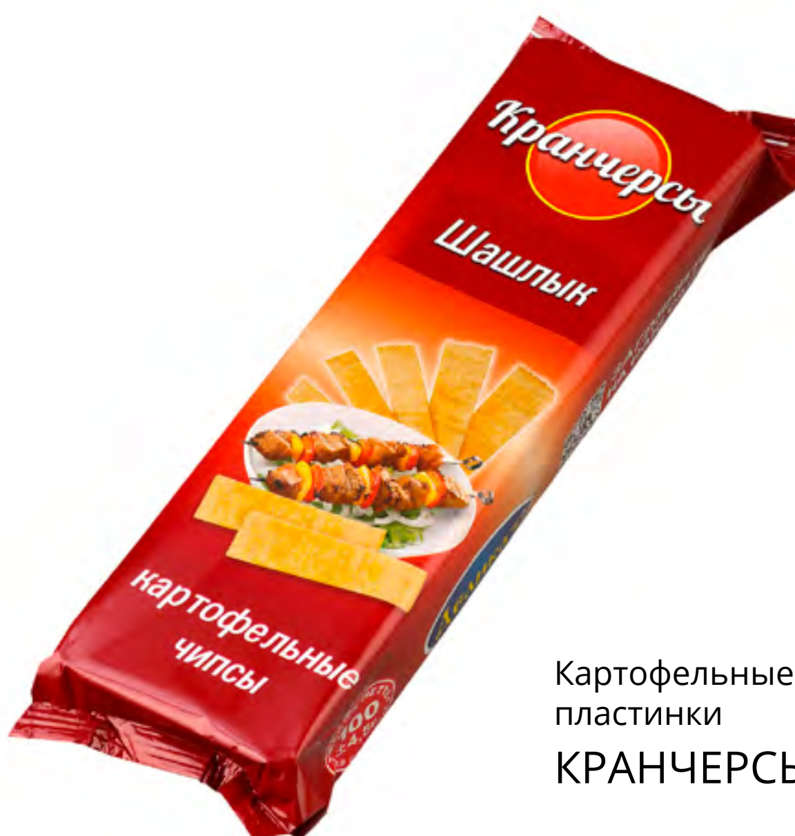
Картофельные пластинки КРАНЧЕРСЫ «ШАШЛЫК»