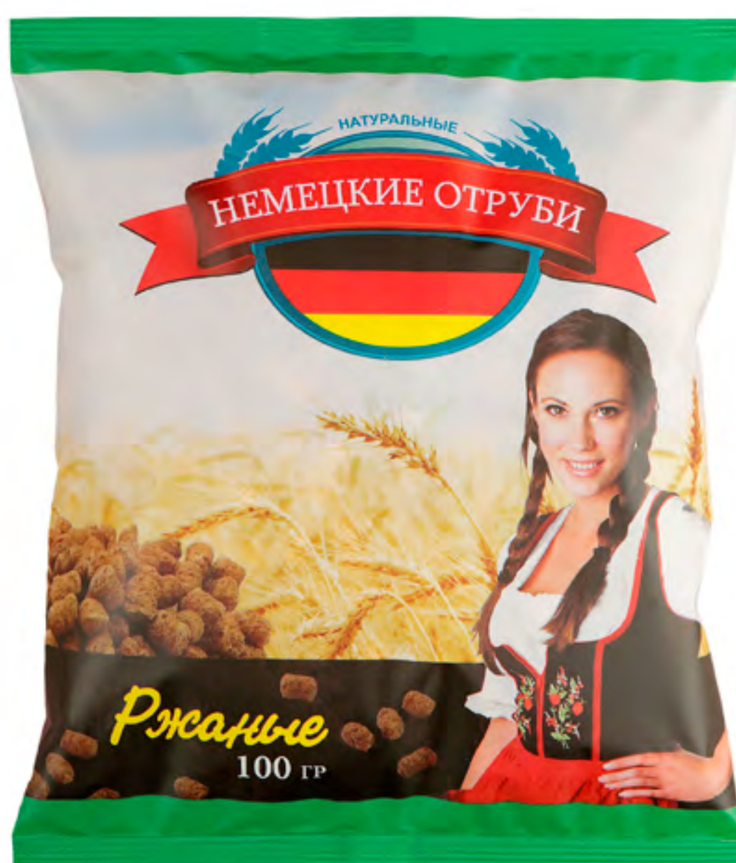
Отруби «НЕМЕЦКИЕ» РЖАНЫЕ