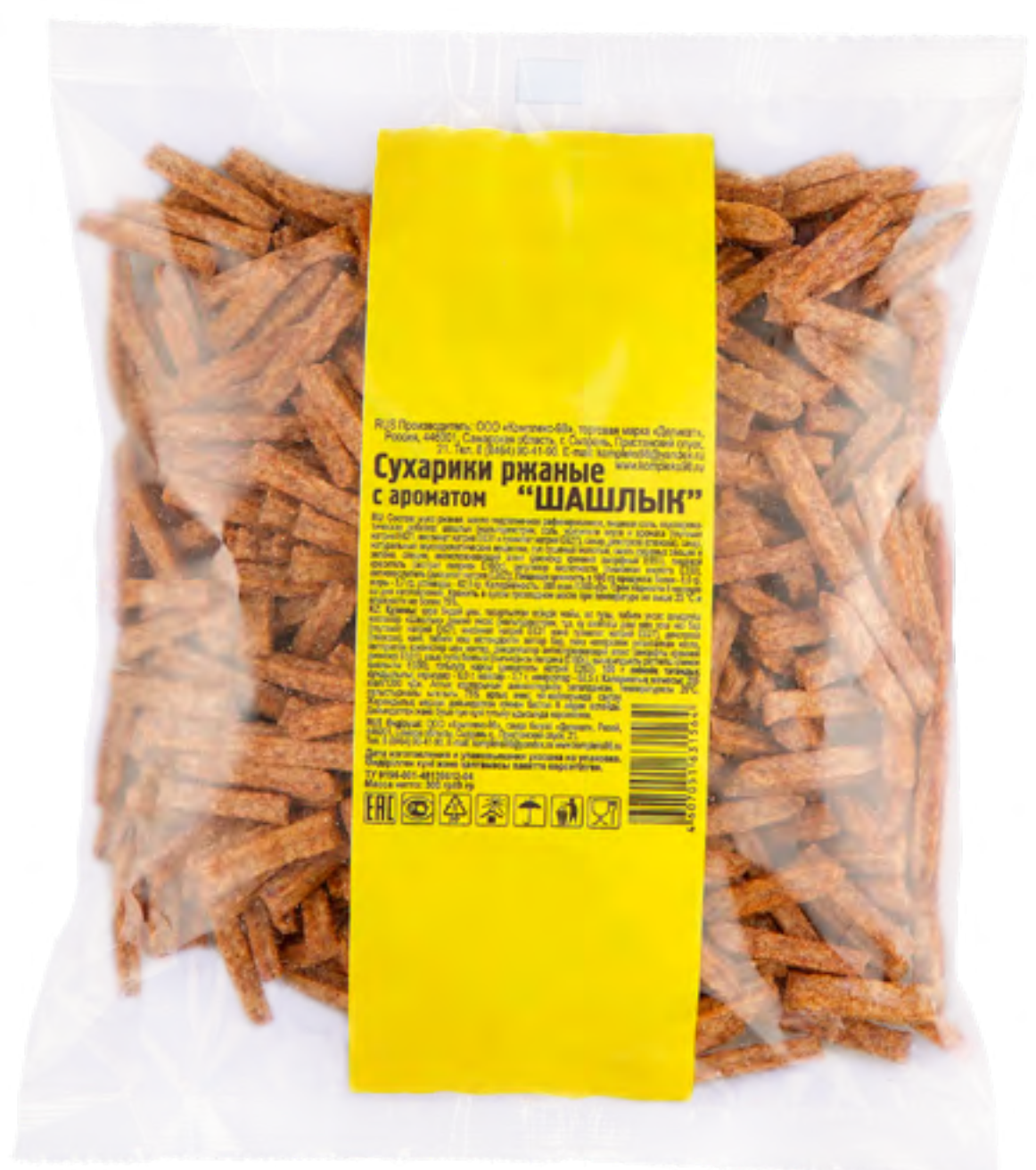
Сушарикки ржаные «ШАШЛЫК»