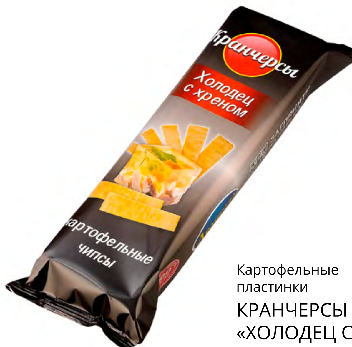
Картофельные пластинки КРАНЧЕРСЫ «ХОЛОДЕЦ С ХРЕНОМ»