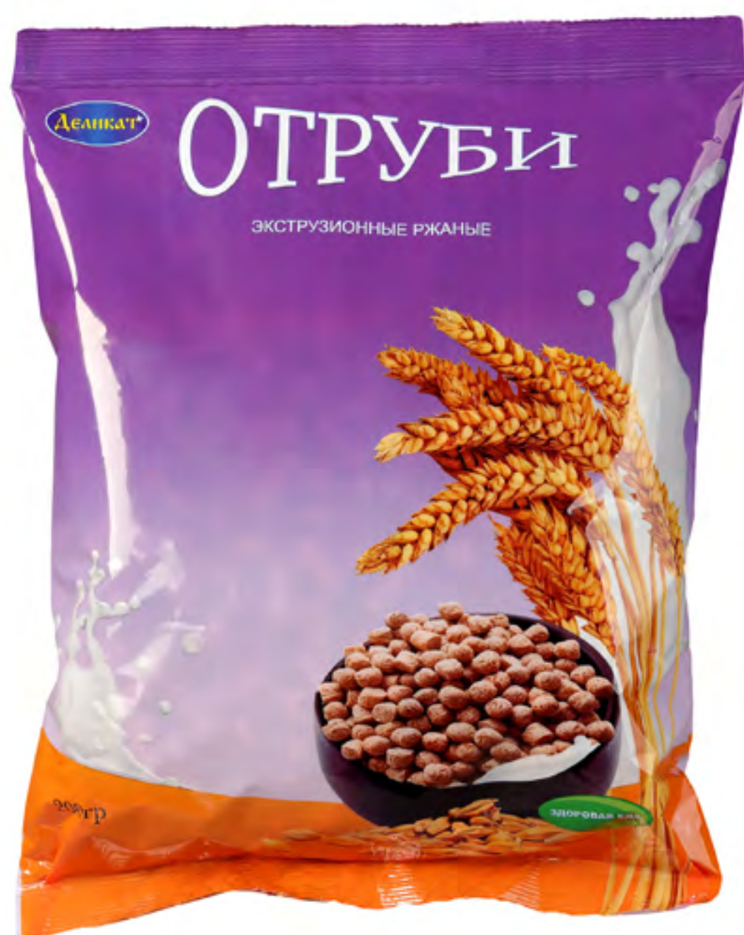
Отруби «НЕМЕЦКИЕ» РЖАНЫЕ