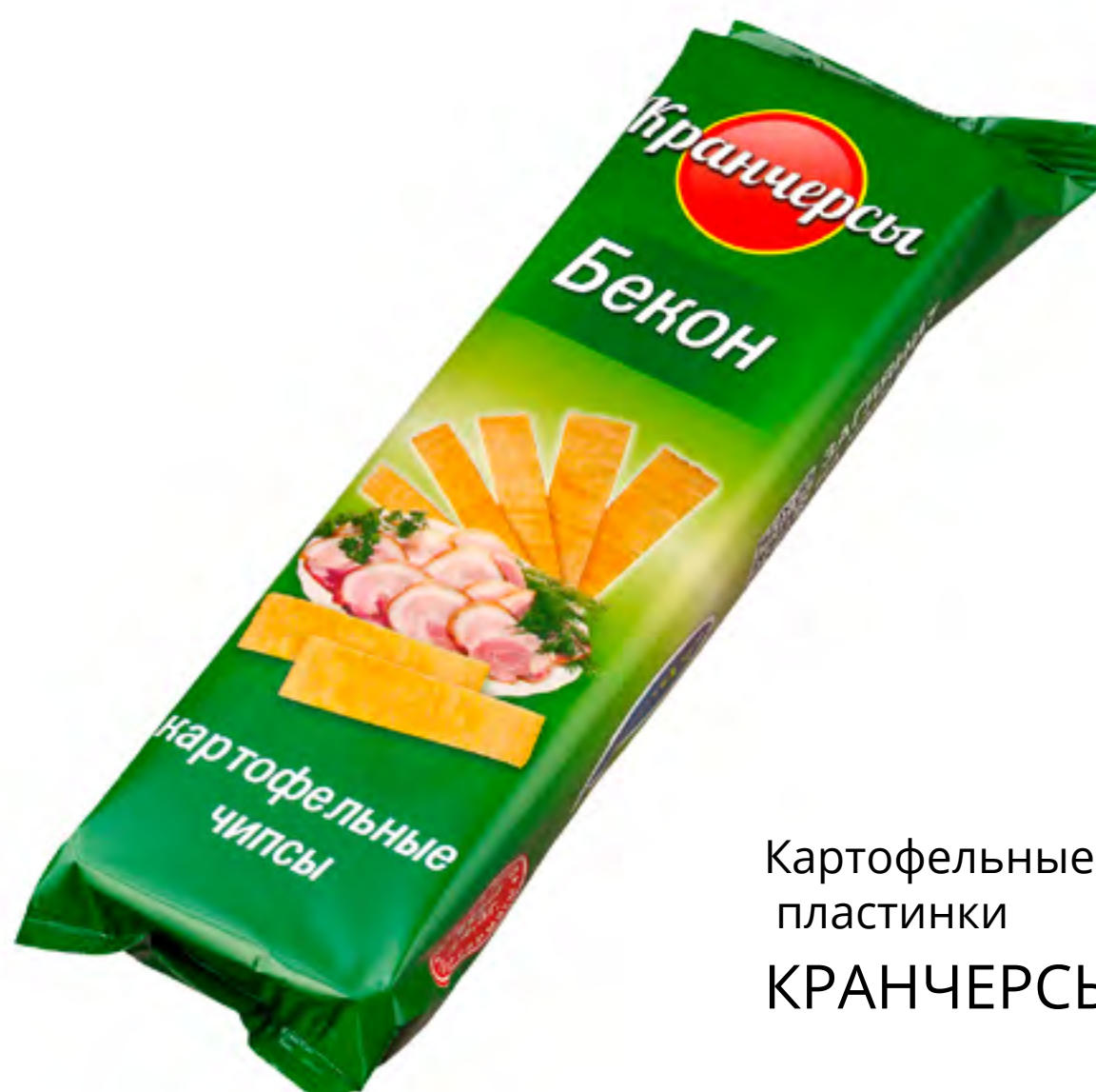
Картофельные пластинки КРАНЧЕРСЫ «БЕКОН»