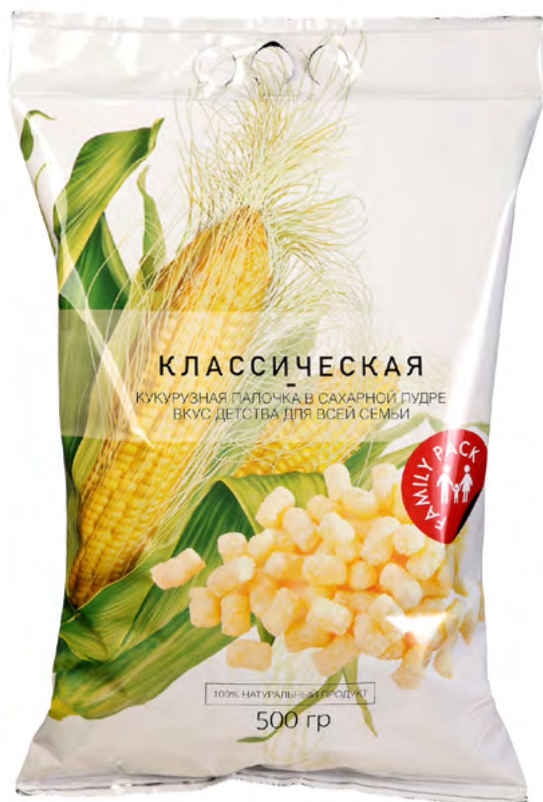
Кукурузная палочка «КЛАССИЧЕСКАЯ»