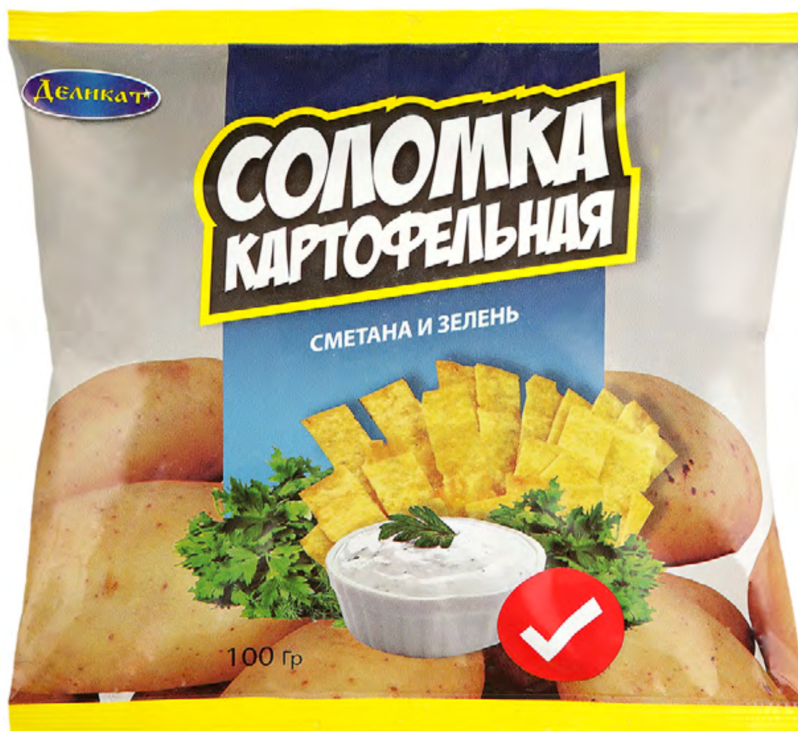
Соломка картофельная «СМЕТАНА И ЗЕЛЕНЬ»