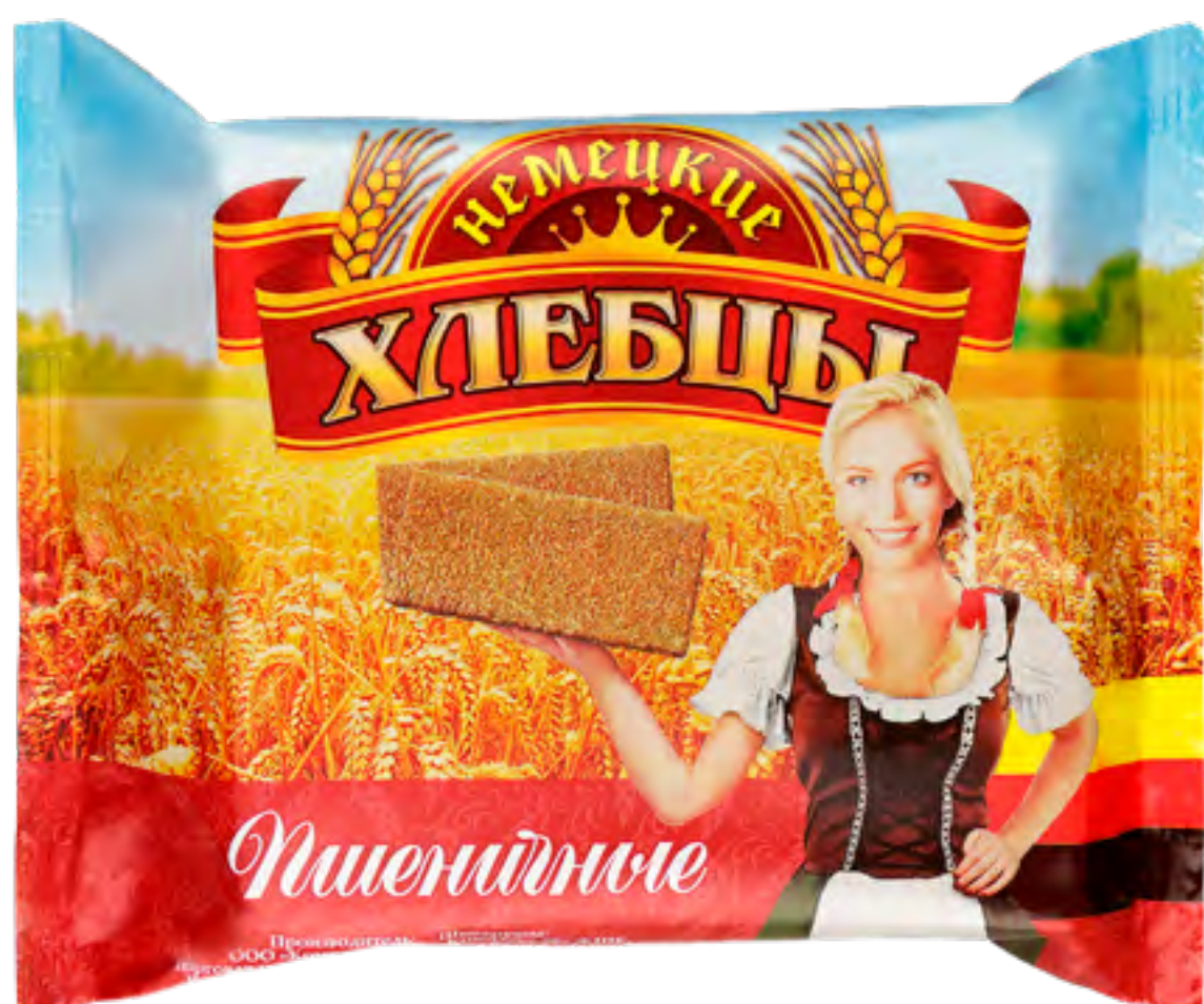
Хлебцы «Немецкие» ПШЕНИЧНЫЕ