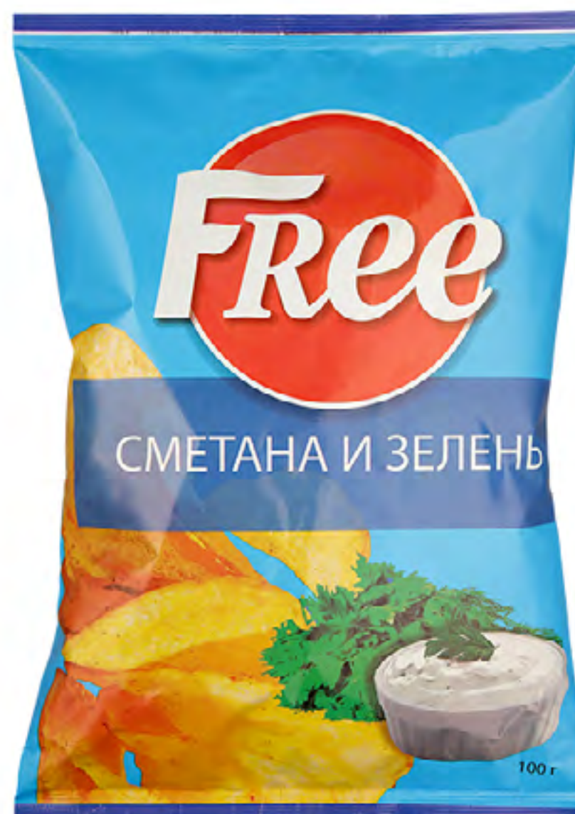
«Сметана и Зелень»