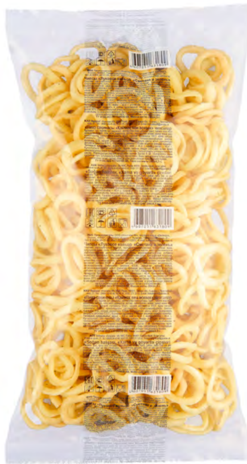
Луковое кольцо «СМЕТАНА И ЗЕЛЕНЬ»