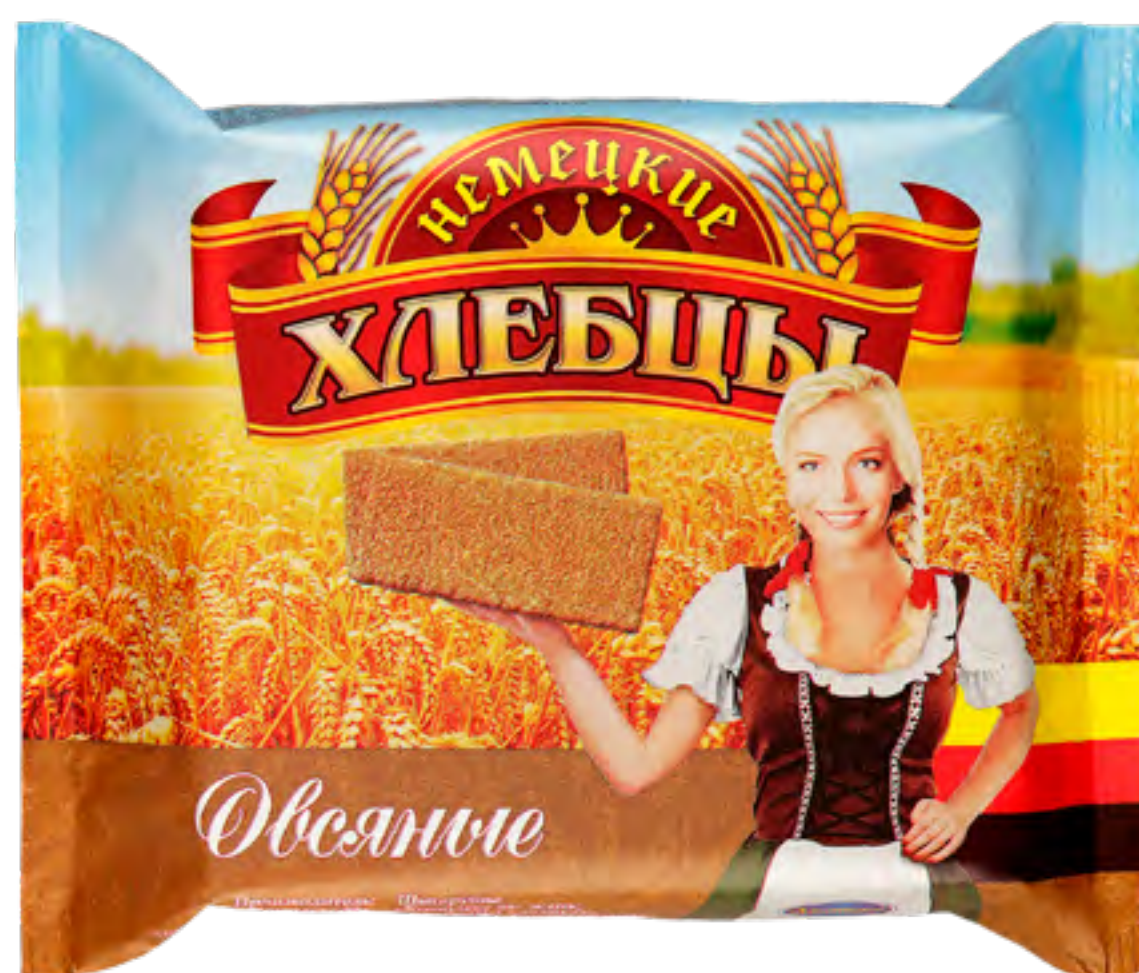
Хлебцы «Немецкие» ОВСЯНЫЕ