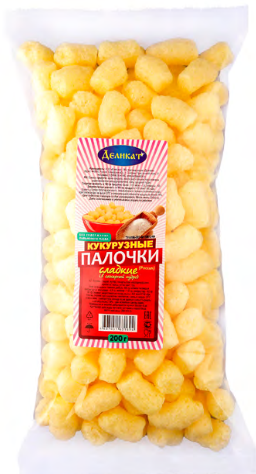
Кукурузная палочка В САХАРНОЙ ПУДРЕ