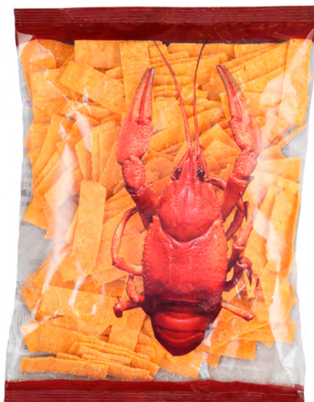
Соломка картофельная «РАК»