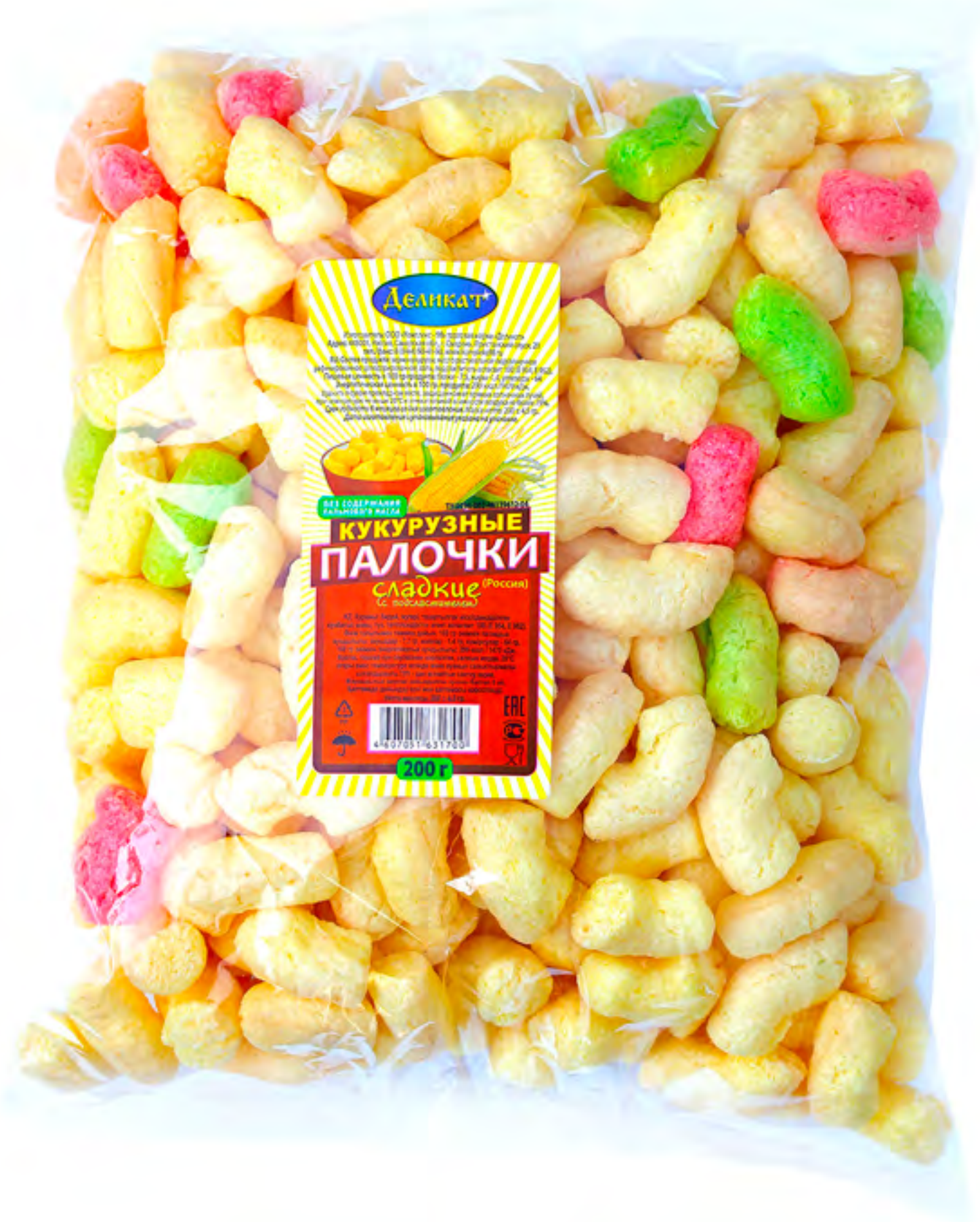
Кукурузная палочка СЛАДКИЕ