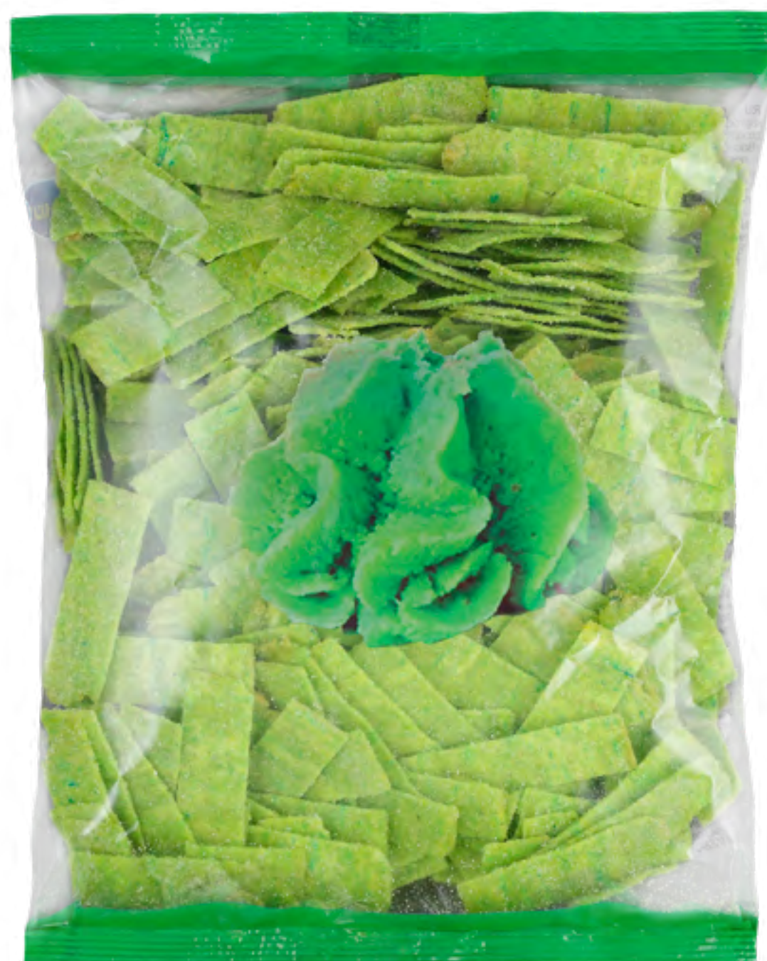
Соломка картофельная «ВАСАБИ»