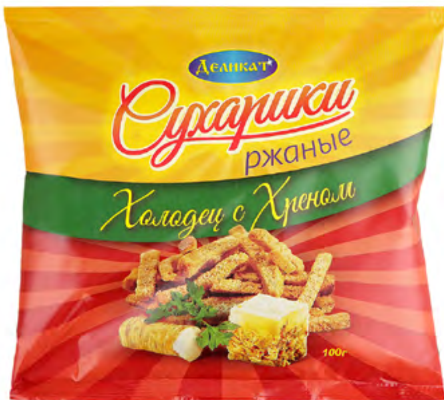
Сушарикки ржаные «ХОЛОДЕЦ С ХРЕНОМ»