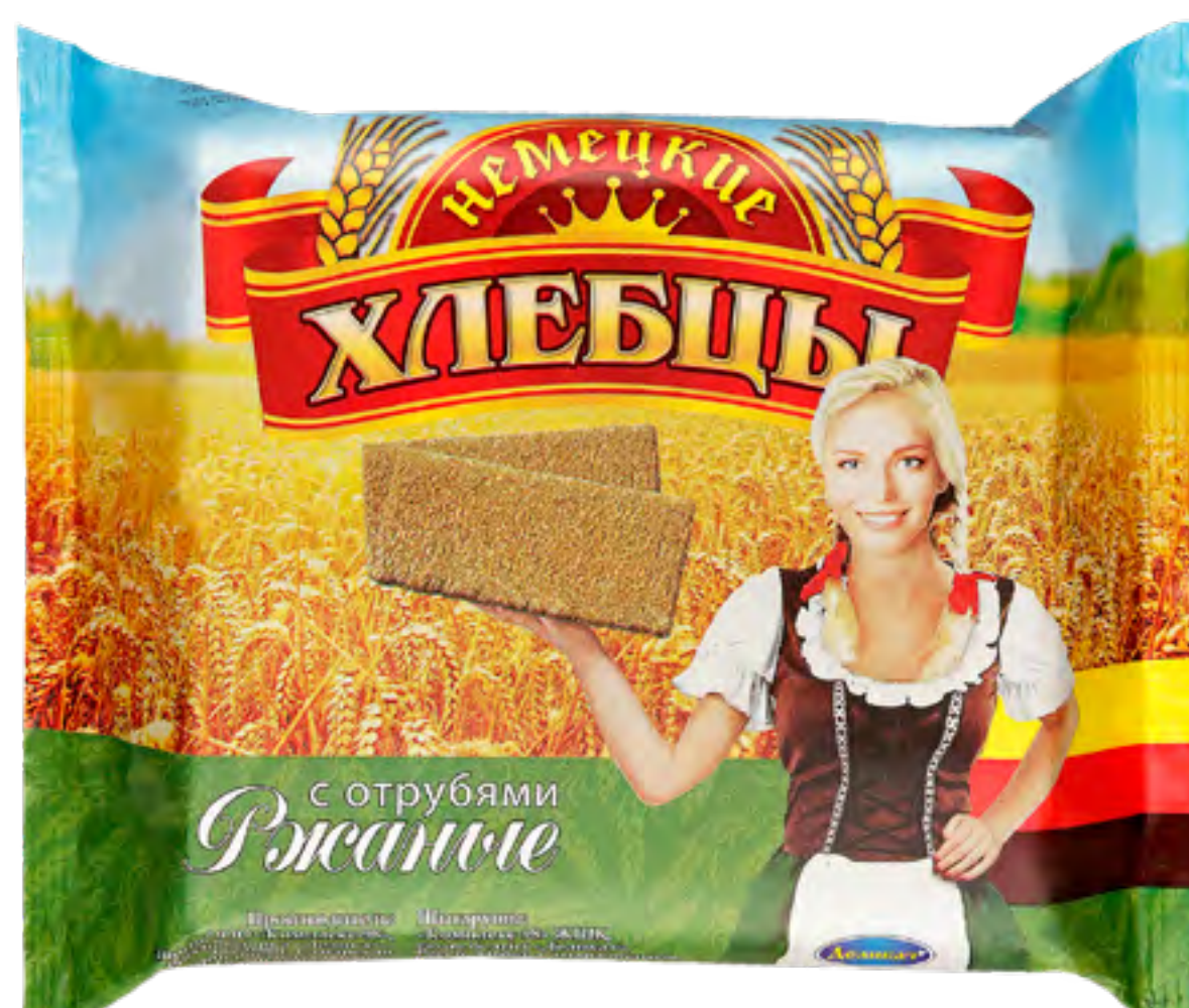
Хлебцы «Немецкие» РЖАНЫЕ С ОТРУБЯМИ