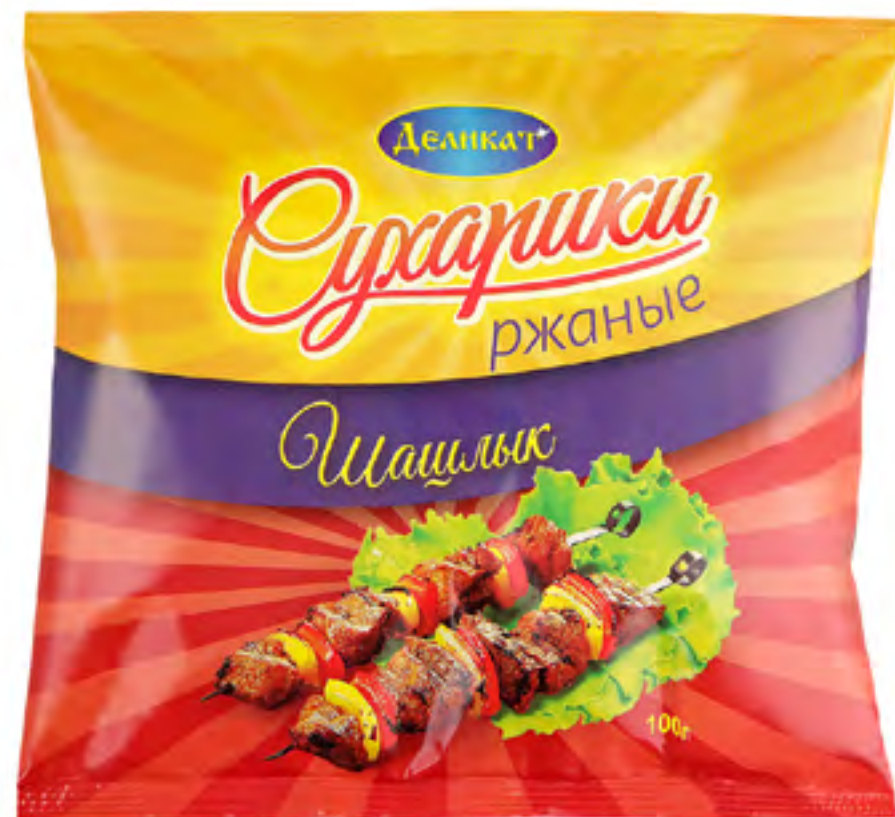
Сушарикки ржаные «ШАШЛЫК»