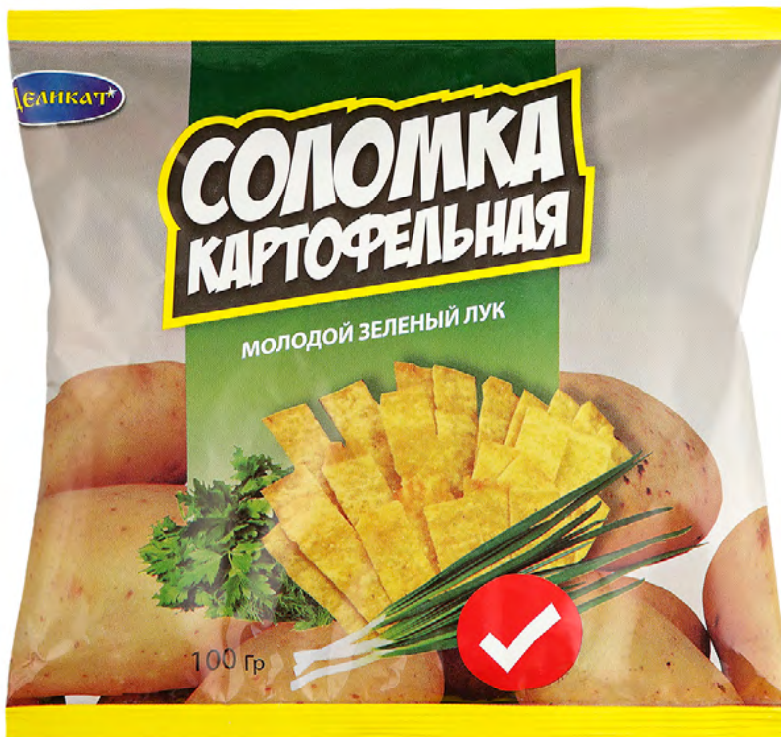
Соломка картофельная «МОЛОДОЙ ЗЕЛЁНЫЙ ЛУК»