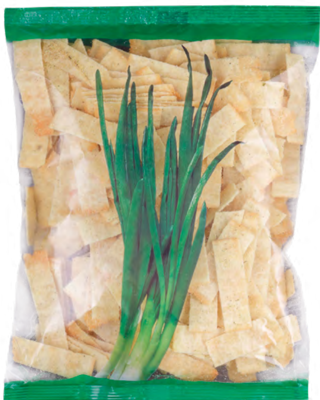
Соломка картофельная «МОЛОДОЙ ЗЕЛЁНЫЙ ЛУК»