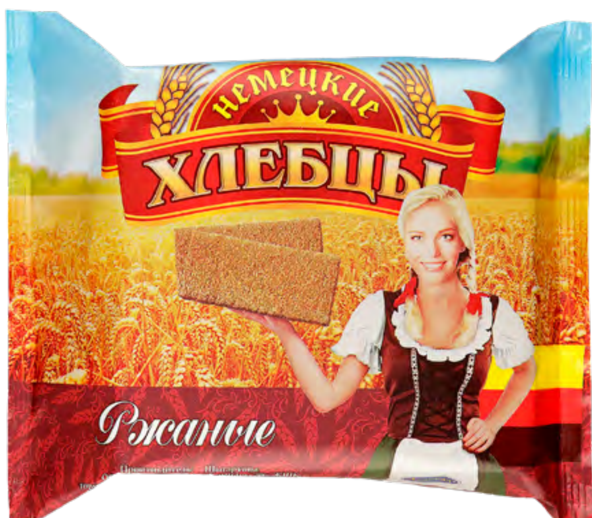
Хлебцы «Немецкие» РЖАНЫЕ