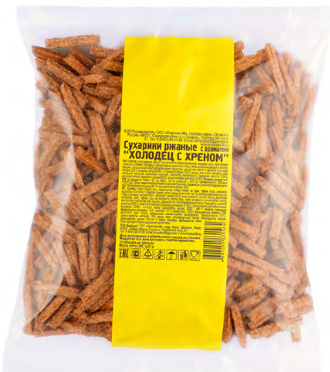
Сушарикки ржаные «ХОЛОДЕЦ С ХРЕНОМ»